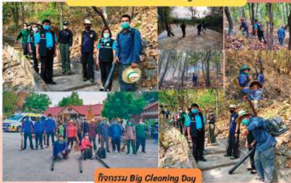
กิจกรรม Big Cleaning Day