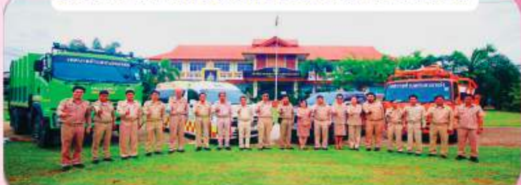
รถพยาบาล (รถตู้)